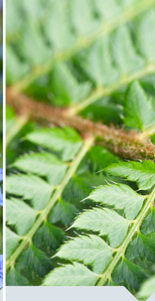
stijve naaldvaren Polystichum aculeatum