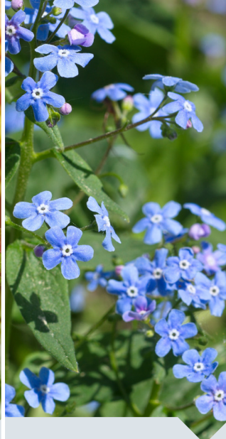
Kaukasisch vergeetmij-nietje Brunnera macrophylla