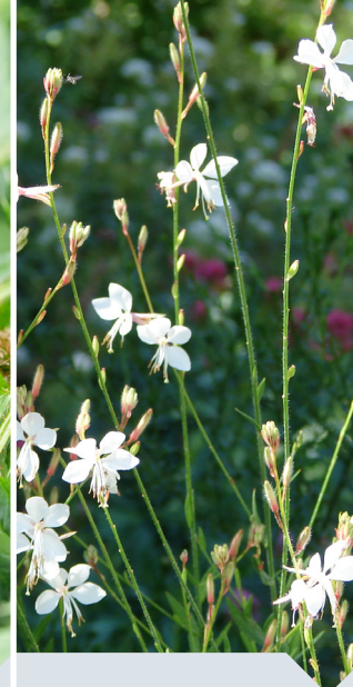
prachtkaaars Gaura lindheimeri