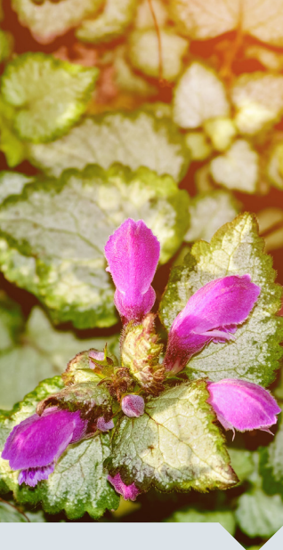
gevlekte dovenetel Lamium maculatum 'Roseum'